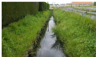
Ces réunions se font dans le cadre de l'élaboration du PPRi du bassin versant des Pieds de Coteaux des Wateringues

Lancée en 2015, l'élaboration du PPRi du bassin versant des Pieds de Coteaux des Wateringues sera soumise à une enquête publique qui se déroulera du mardi 28 septembre au jeudi 4 novembre. Il s'agit de la dernière étape du travail de concertation important mené dans le cadre de cette élaboration, au cours de laquelle chaque étape a été validée par les acteurs du territoire et où les échanges ont permis de faire évoluer le dossier de manière constructive. Afin de présenter la procédure