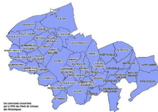
Les communes concernées par le PPRI des Pieds de Coteaux des Wateringues

Lundi et hier, l’État a organisé deux réunions publiques à Guînes et Zutkerque pour présenter à la population la carte des aléas du plan de prévention des risques d’inondation (PPRI) des pieds de coteaux des wateringues. Encore au stade des études techniques, le document sera prêt courant 2020.